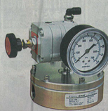
圧力レギュレーター