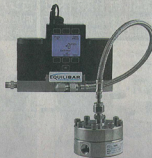
電子圧力レギュレーター