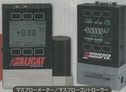
マスフローメーター/マスフローコントローラー