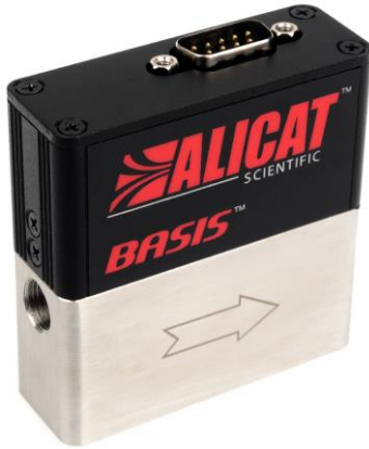
BASISマスフローコントローラー