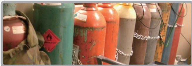
※ALICAT 実験室 使用ガス写真