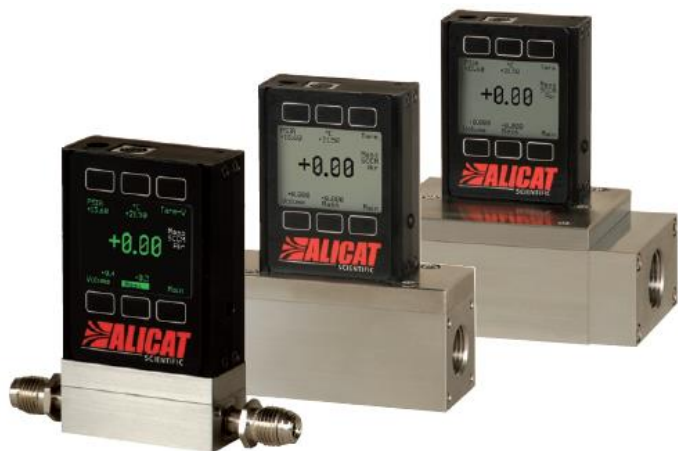
マスフローメーター Mシリーズ