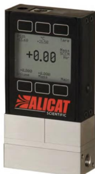
マスフローメーター 腐食性ガス/冷媒ガス対応 MSシリーズ