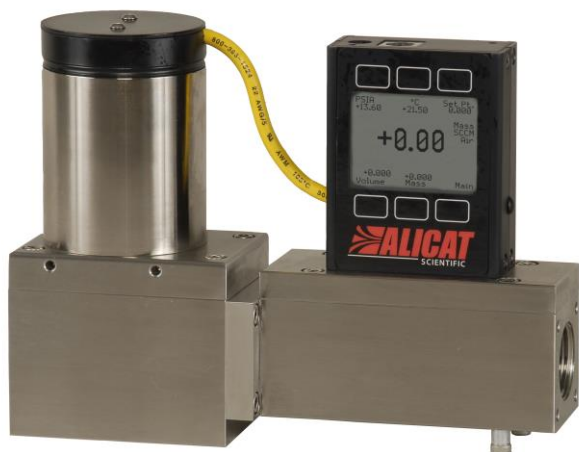
マスフローコントローラー MC/MCRシリーズ