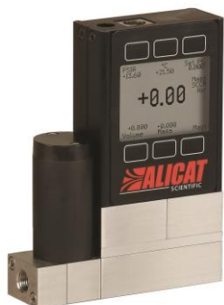
マスフローコントローラー 腐食性ガス/冷媒ガス対応 MCS/MCRSシリーズ