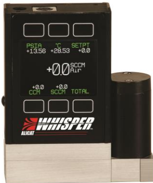
(カラー液晶・バルブ下流設置タイプ) WHISPERマフスローコントローラー 低圧力損失タイプ MCW/MCRWシリーズ