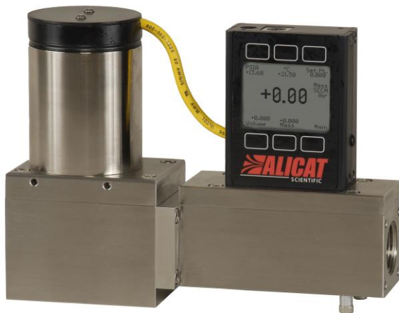
マスフローコントローラー MC/MCRシリーズ